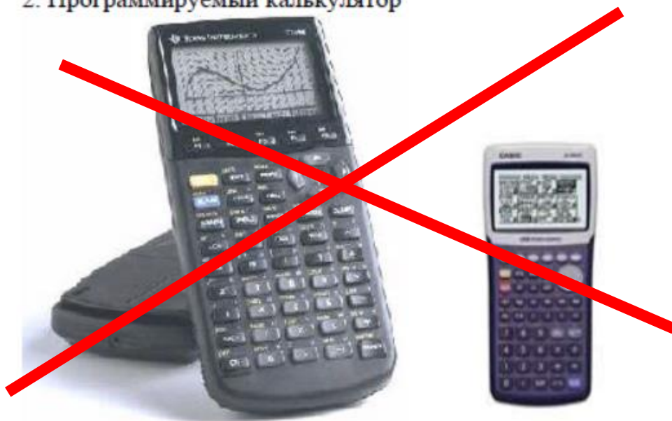
2. Программируемый калькулятор